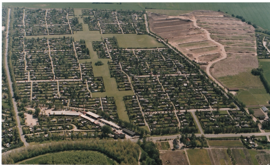
Rønhøjgård set fra luften efter de første 25 år.